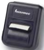
PB 20-Bluetooth Printer 2.5"