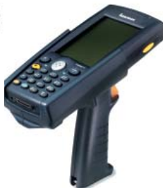
700 Scan Handle